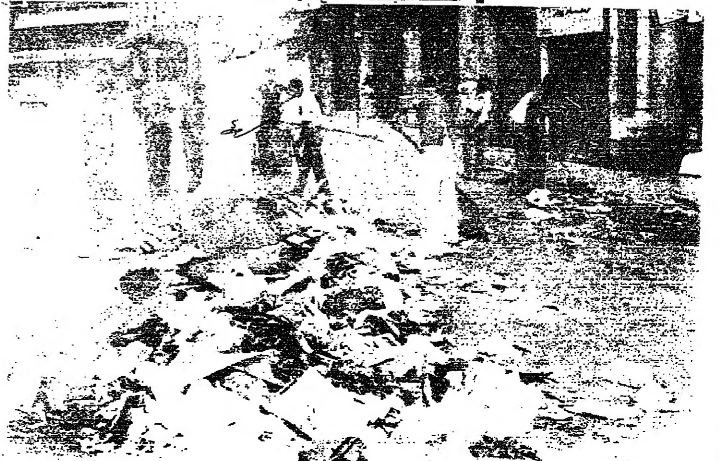
■ اكوام من النفايات ينولى عمال المنظمات ازلها